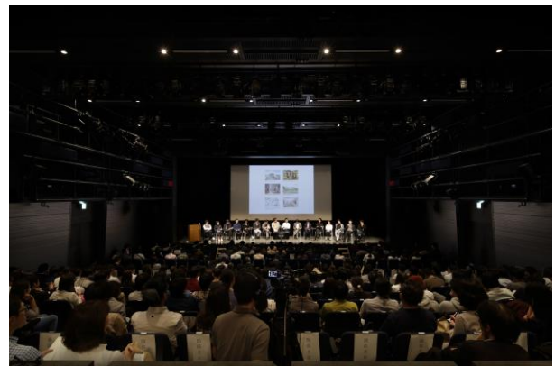
2015年度のシンポジウム会場風景