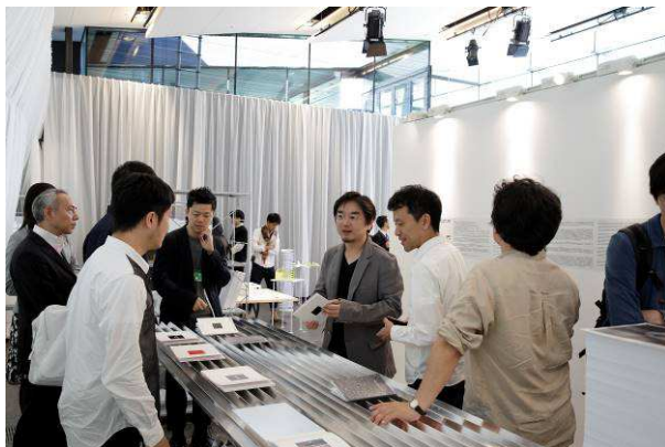
2015年度の展覧会会場風景