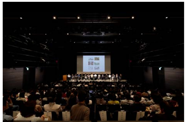
2015年度のシンポジウム会場風景