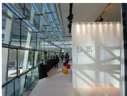
会場エントランス